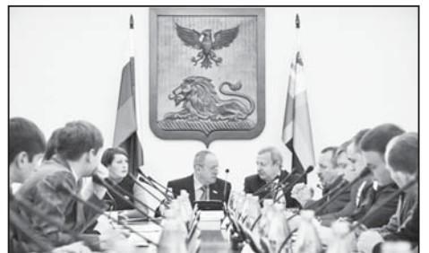
Круглый стол «Роль молодёжи в формировании солидарного общества», организованный Белгородской областной Думой