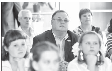
Депутат Геннадий Шипулин на уроке в одной из школ Белгородского района