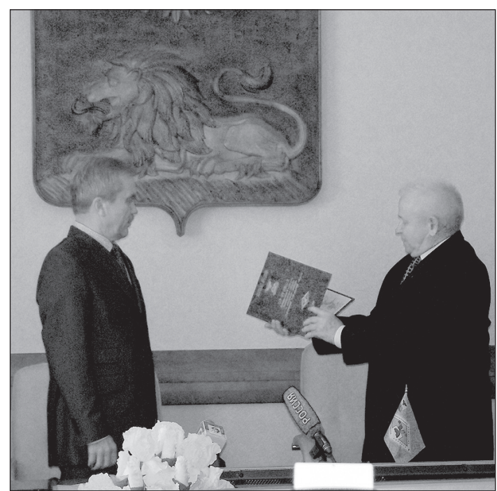
По просьбам читателей публикуем сегодня (на 2-й странице) сводную таблицу о результатах выборов губернатора Белгородской области, дающую наглядное представление о голосовании «в разрезе» городов и районов.